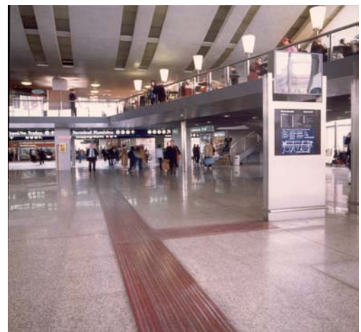
Stazione ferroviaria di Roma Termini