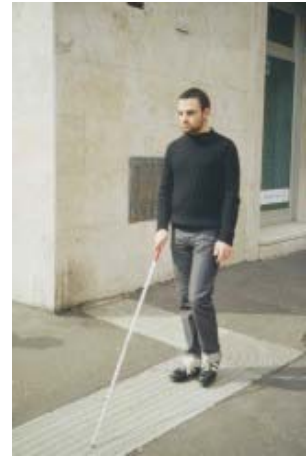
Percorsi tattili in ambito urbano

Nel campo della consulenza per l'accessibilità di luoghi e percorsi, CSSI (ONLUS) si occupa della progettazione e realizzazione di mappe tattili per la fruizione autonoma dei luoghi da parte dei disabili visivi, nonché della consulenza e formazione nel campo della progettazione senza barriere. Collaborano con noi professionisti della progettazione specializzati nelle esigenze dei soggetti con disabilità ed un gruppo di collaudo formato da utenti disabili, che controllano e apportano eventuali modifiche ai servizi e ai prodotti da noi proposti.