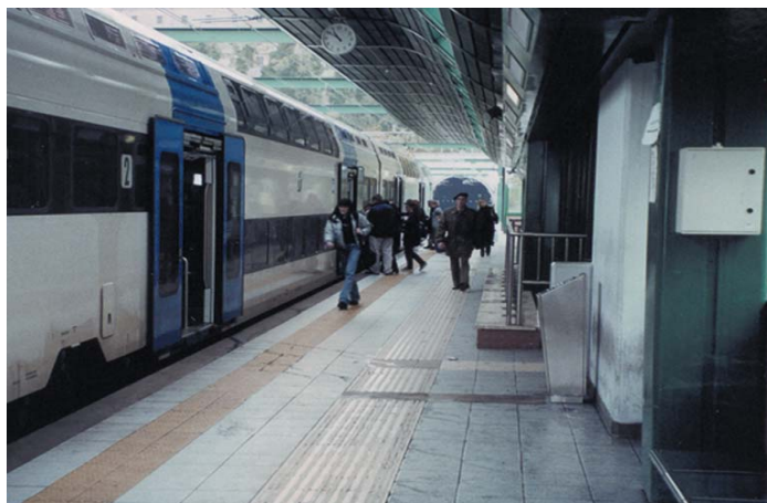
Fermata della FM3 Valle Aurelia – Roma