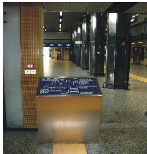
Aeroporto Milano Malpensa

Organizzazione e realizzazione di corsi ed altre iniziative di formazione professionale nel settore dell'abbattimento delle barriere architettoniche e senso-percettive.