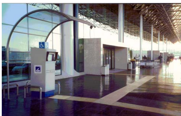
Aeroporto L. da Vinci – Fiumicino

Realizzazione di guide all'accessibilità in forma multimediale direttamente fruibili dai disabili della vista, su supporto cartaceo, in forma di mappe tattili cartacee su schede mobili,, in supporto audiomagnetico e in forma elettronica.