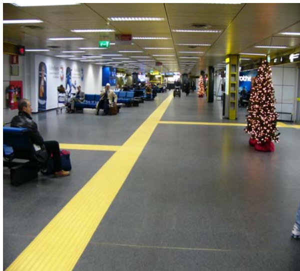
Aeroporto Milano Linate